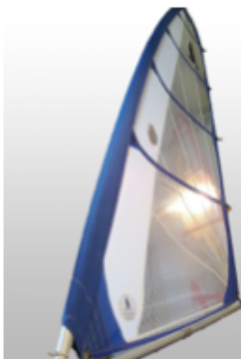
Voile d'origine du MAX XL, 6 M2 Mylar translucide, décoration bleue

Nos voiles sont disponibles en Mylar (tissu translucide, vous pouvez voir au travers, c'est la voile la plus esthétique, idéale pour un particulier) ou en Dacron (tissu plus résistant, que vous pouvez « chiffonner » sans crainte, permet également d'ajouter une de prise de ris sur demande). D'origine, le MAX XL est équipé d'une voile Mylar 6 M 2 , idéale pour un char de ce gabarit.