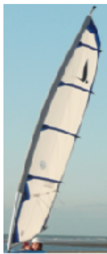
Voile 6 M2 Dacron à ris (Blanche opaque, décoration bleue).